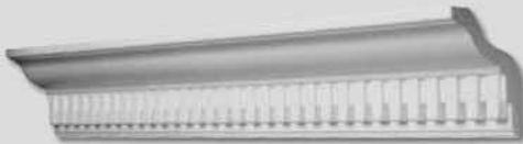
Celine, VPE: 1 x 2 m Art.-Nr. 3739, Karton: 16 VPE EAN 4007155111236