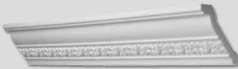
Marielle, VPE: 1 x 2 m Art.-Nr. 3740, Karton: 20 VPE EAN 4007155111267